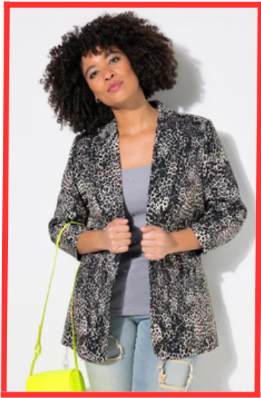
nicht erkennbar, ob Top oder Blazer verkauft wird