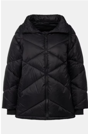
BÜSTENBILD + KURZE TRAGEMÖGLICHKEIT