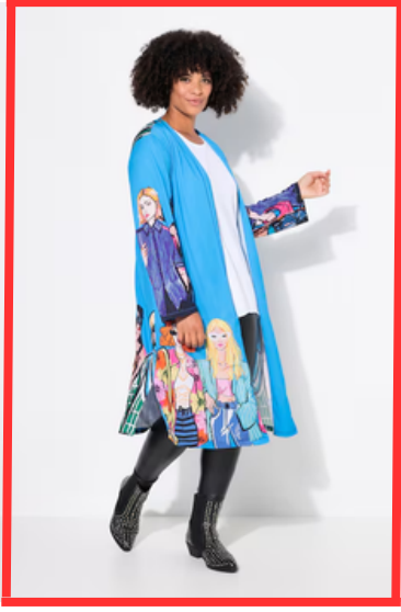
Passform der Hose nicht erkennbar