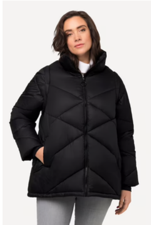
MODEL BILD (LANGE + KURZE TRAGEMÖGLICHKEIT)